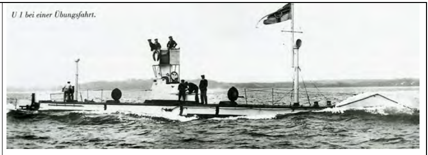
U 1 bei einer Übungsfahrt.